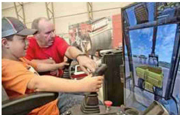
Fast wie echt: Ein Junge sitzt in einem Baggersimulator.